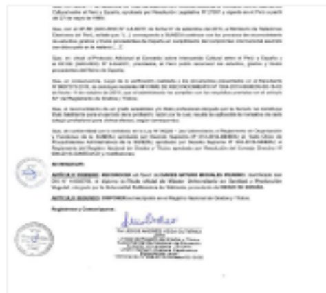
Fuente. RESOLUCIÓN N° 7278-2019-SUNEDU-02-15-02

Del mismo modo se verifico que la normativa referida a los títulos oficiales de enseñanza del gobierno de España, vinculadas a programas oficiales de Máster universitarios. Este necesita ser un programa entre 60 a 120 créditos y sea necesario contar con un título profesional. Ver textos del reglamento: