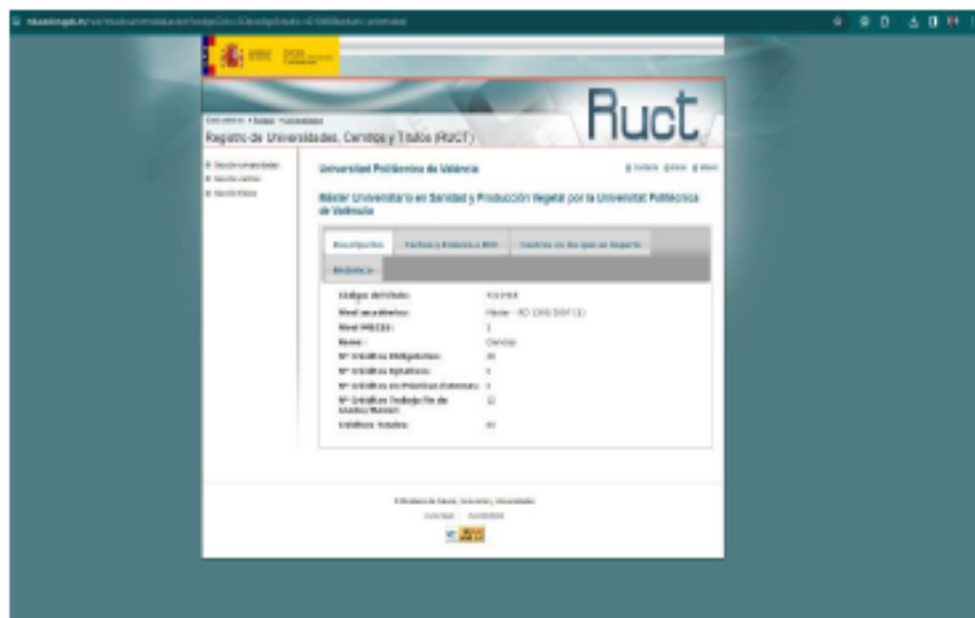
Figura 2 Registro del Máster Universitario cursado en España

de Máster y de la rama de Ciencias. Por tanto, corresponde otorgar puntaje por este ítem en el indicador A.